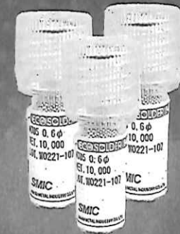
SMIC 製 SOLDER BALL 2CC 特殊ボトル入り (メイショウ専売製品)